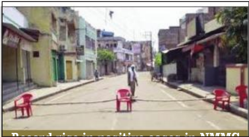
Record rise in positive cases in NMMC